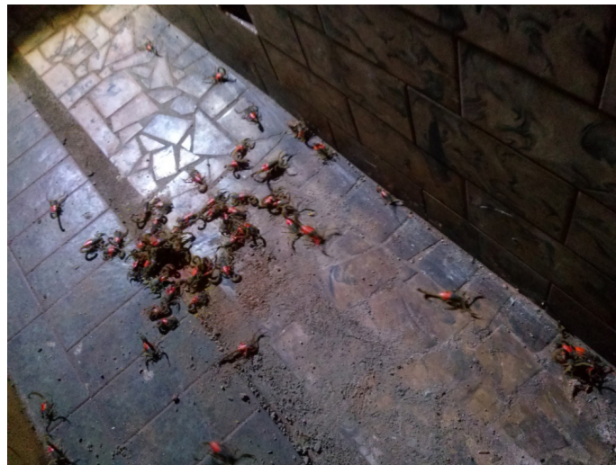
Figura 1. Liberação dos escorpiões Tityus serrulatus marcados em agosto de 2014.

Foram realizadas varreduras com leituras periódicas em raio de 4 metros, a partir da soltura dos espécimes. A distância máxima de leitura no experimento ocorreu no limite de 36 metros. Com base no fotoperiodismo dos escorpiões, a atividade foi executada, inicialmente, por meio de coleta de dados durante o período da manhã, intervalo de menor atividade dos espécimes e, posteriormente, em horário noturno, quando esses animais estão mais ativos 10,11 .