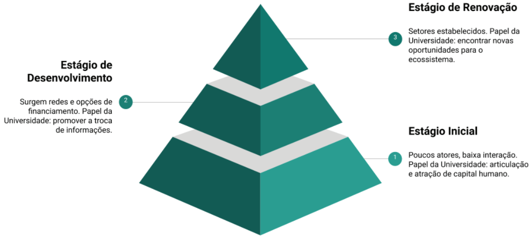
Figura 3 - Estágios dos ecossistemas de inovação

Fonte: baseada em Heaton, Siegel e Teece (2019).