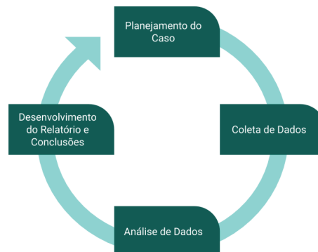
Figura 4 - Método de Pesquisa

2015). O estudo de caso é um método de pesquisa empírico, utilizado para investigações de fenômenos contemporâneos, principalmente quando os limites entre esse fenômeno e o seu contexto não estão claramente definidos (EISENHARDT; GRAEBNER, 2007; YIN, 2015). As etapas seguidas para execução deste trabalho são apresentadas na figura 4.