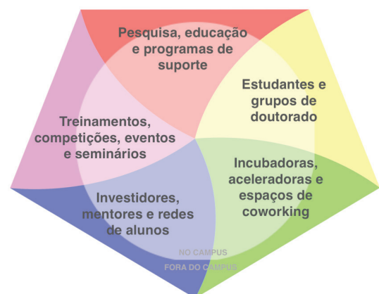
Figura 2 - Modelo de capacidades dinâmicas