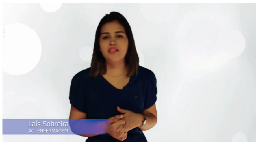
► Figura 2: Tela ilustrativa de um episódio do videocast.

A última etapa abrangeu a publicação dos Videocasts na plataforma Youtube com as con-