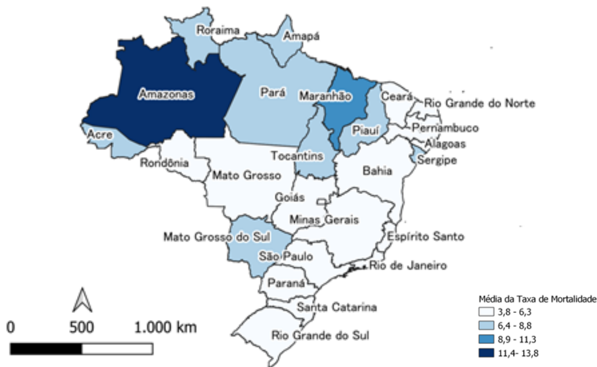
Figura 2. Distribuição geográfica da Taxa Média da Mortalidade por Câncer de Colo do Útero segundo Unidade Federativa. Brasil, 2010 a 2019.